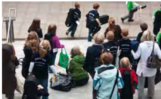
Kinder aus ganz Niedersachsen präsentierten ihr Können

Die Besucher begrüßten den Kongress mehrheitlich als hochwillkommenes Forum für kollegiale Gespräche, Diskussion und interdisziplinären Austausch. Auf ihrer Wunschliste ganz oben steht daher: „Mehr davon!“