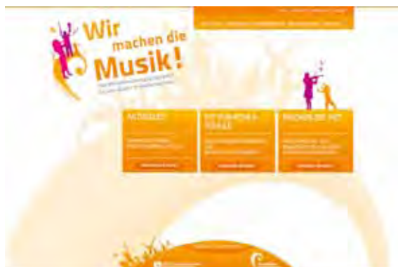
Die Startseite von www.wirmachendiemusik.de

Im Servicebereich können das Logo des Programms und weiteres Informationsmaterial heruntergeladen werden.