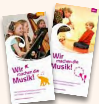
Titelmotive des Kita- und Schulflyers

→ Wir machen die Musik! – in der Schule Gemeinsames Singen und Musizieren wirkt sich motivierend auf das Erlernen eines Instrumentes aus, stärkt die Klassengemeinschaft und hat einen positiven Einfluss auf das Sozialverhalten der Kinder. Geeignete Angebote finden sich in dem großen didaktisch-methodischen Repertoire des instrumentalen und vokalen Klassenmusizierens. Klassenorchester – bestehend aus gleichen oder verschiedenen Instrumenten aus nahezu jeder Instrumentenkategorie – und Klassenchöre ergänzen den schulischen Musikunterricht ideal und bilden die Basis für das Erlernen eines Instrumentes und die aktive Beschäftigung mit Musik.