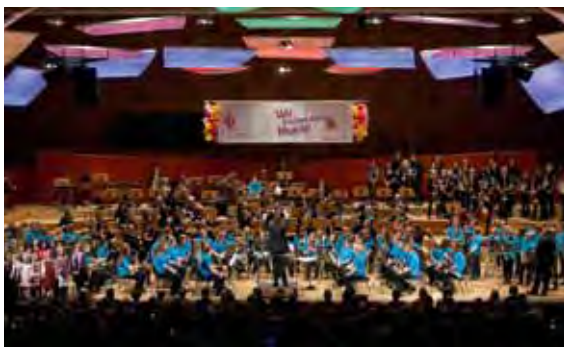
Großes Finale im großen Sendesaal des NDR

Wir machen die Musik! vermittelt vielen Kindern erste Musikerlebnisse und legt so bei vielen Familien den Grundstein für ein besonderes Interesse an Musik. Dies fand die NDR Radiophilharmonie so überzeugend, dass sie sich bereit erklärte, gemeinsam mit den Schülerinnen und Schülern aus Musikschulen ein ganz besonderes Konzert zu veranstalten. Einzige Voraussetzung: alle mitwirkenden Kinder sollten an Kooperationsprojekten mit Kitas und Schulen teilnehmen.